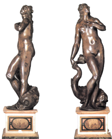
Anonyme, Italie, Venise, Vénus marine , 16 e siècle | Bronze (salle 1)

Épouse de Vulcain, Vénus, déesse de la beauté, a de nombreuses liaisons amoureuses avec diverses divinités, engendrant des descendants comme Cupidon, dieu de l'amour. Les attributs de Vénus incluent le coquillage, le miroir, la rose ou la pomme, en référence au Jugement de Pâris. La présence du dauphin évoque ici sa naissance dans les flots, tel qu'Hésiode la narre dans la Théogonie (v. 154–210) et qui la rapproche de l'iconographie de Venus dite anadyomène, qui signifie « sortie des eaux ». L'œuvre de la Fondation est réalisée à Venise au 16 e siècle par un artiste inconnu et est caractéristique de la production de petites statuettes de bronze dans cette région du nord de l'Italie. Inspirée de l'Antiquité, redécouverte au 15 e siècle, la statuette « Vénus Marine » utilise les codes de la statuaire antique, comme le contrapposto et le chiasme, pour créer une illusion de mouvement. Son succès tient à sa finesse et à son format, qualités particulièrement appréciées des premiers collectionneurs d'art.