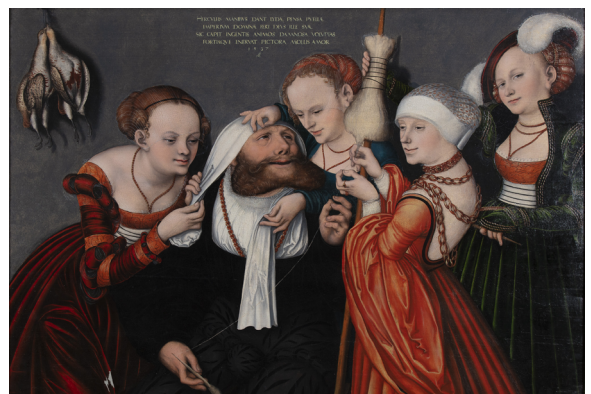
Lucas Cranach l'Ancien, Hercule et Omphale , 1537 | Huile sur bois (salle 5)

L'œuvre « Hercule et Omphale » de Lucas Cranach l'Ancien illustre une scène mythologique où Hercule est condamné par l'oracle de Delphes à servir Omphale, reine de Lydie. Omphale oblige Hercule, symbole de force et de virilité, à se travestir en femme et à filer la laine. Malgré sa soumission, Hercule tombera amoureux d'Omphale et inversement, soulignant la réciprocité de leur relation. Ce tableau, typique de la Renaissance des écoles du Nord, joue sur le comique de renversement des rôles et montre le pouvoir de l'amour qui domine même les héros les plus virils. Un quatrain en latin au-dessus des personnages vient expliciter le thème.