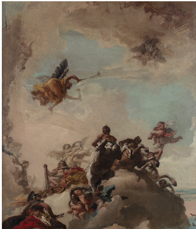
Giandomenico Tiepolo, L'apothéose d'Hercule , entre 1760 et 1762 | Huile sur toile (salle 6)

Le tableau de la Fondation est une œuvre préparatoire, aussi appelé modello en italien et réalisée par Giandomenico Tiepolo, fils de Giambattista. Ce modèle était destiné à un plafond, illustrant parfaitement le processus d'apothéose, soit la réception du héros parmi les dieux, dans une composition qui crée un effet d'illusion et de trompe l'oeil en s'affranchissant de toute architecture et en s'ouvrant sur un ciel infini.