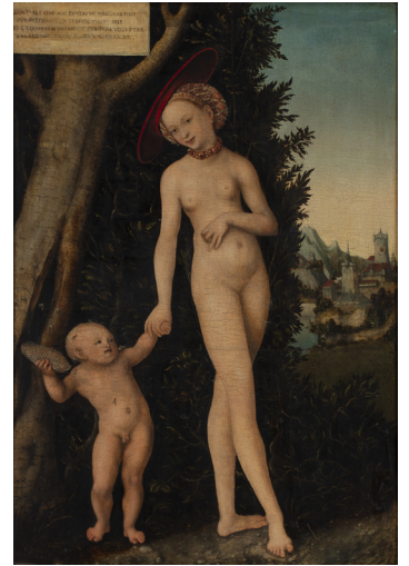
Lucas Cranach l'Ancien, Vénus et Cupidon volant du miel , 1531 | Huile sur bois (salle 5)

L'inscription latine en haut à gauche du tableau renvoie à la 19 e idylle du poète grec Théocrite et révèle le sens de la scène que l'artiste donne à voir. Cupidon ayant volé un rayon de miel, pleure de douleur après s'être fait piquer par les abeilles. Lucas Cranach l'Ancien, artiste de la Renaissance en Allemagne, aurait décliné près de 3 versions différentes de ce tableau.