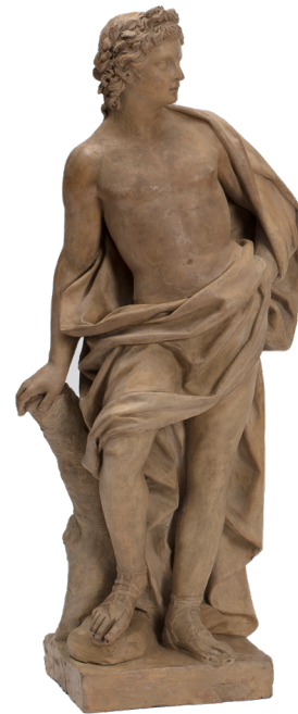
Domenico Pio, Apollon , Deuxième partie du 18 e siècle | Terre cuite (salle 3)

Apollon, dieu grec des arts, du soleil, et de la guérison, est également connu pour ses amours contrariés. Dans le mythe d'Apollon et Daphné, raconté par Ovide dans les Métamorphoses (I, 452-567), Eros est vexé par Apollon et pour se venger, lui tire une flèche d'or, faisant naître en lui un amour passionné pour Daphné. Celle-ci, touchée également par Éros mais par une flèche de plomb, le rejette et tente de fuir les avances d'Apollon qui se lance à sa poursuite. Alors qu'il est sur le point de la saisir, Daphné supplie son père, le dieu fleuve Pénéée, de la transformer en laurier pour échapper à ses avances. Apollon honore alors Daphné en faisant du laurier son symbole, qu'il porte en couronne. Ce mythe illustre la dualité d'Apollon, divinité à la fois lumineuse et sombre, maître des arts et porteur de châtements.