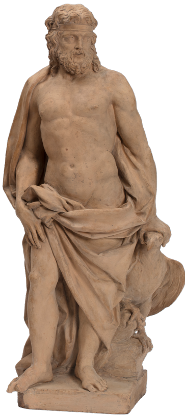
Domenico Pio, Jupiter , deuxième moitié du 19 e siècle | Terre cuite (salle 3)

Domenico Piò est un sculpteur bolonais du 18 e siècle. Privilégiant le modelage et la terre cuite à la taille de pierres, rare dans la région de Bologne, son œuvre témoigne de l'évolution artistique en Italie du baroque vers le rococo.