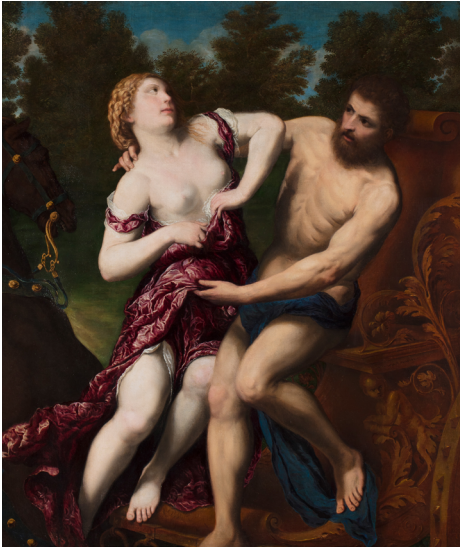
Paris Bordone, Le rapt de Proserpine , vers 1555-1560 | Huile sur toile (salle 1)

Seul élève de Titien mentionné par Vasari dans ses biographies d'artistes Vies, Paris Bordone a créé des œuvres religieuses, mythologiques et des portraits. Ses peintures allégoriques associent volupté et mythologie comme dans le cas de ce tableau, inspiré du rapt de Proserpine, narré par Ovide dans les Métamorphoses (V, 341-571). Proserpine est la fille de Cérès, déesse du blé, de la fertilité et de la terre cultivée. Proserpine est enlevée par Pluton qui, amoureux d'elle, l'entraîne dans les Enfers. Cérès, à la recherche de sa fille, fini par découvrir la trahison de Pluton et pour se venger, prive la terre de végétation et de récolte. Jupiter, inquiet pour les mortels tributaires des récoltes, ordonne le retour de Proserpine à condition qu'elle n'ait mangé aucune nourriture dans les Enfers. Pluton, au courant de cette condition, lui donne alors des graines de grenade ce qui la condamne à vivre pour l'éternité à ses côtés. Pour autant, un compromis est trouvé : Proserpine passera six mois avec Pluton et six mois avec sa mère. Enfermée dans les enfers, elle est comme le grain de blé, enseveli sous terre durant l'automne et l'hiver. Son retour auprès de Cérès correspond à la renaissance de la végétation, au retour du Printemps et à la prospérité de la vie durant l'été.