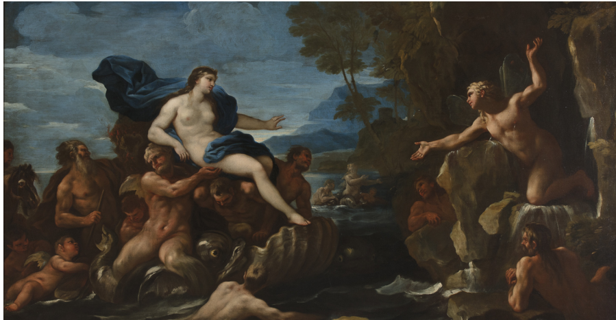
Luca Giordano, Acis et Galatée , vers 1685 | Huile sur toile (salle 2)

Luca Giordano, peintre baroque napolitain, est célèbre pour ses fresques et peintures qui illustrent des thèmes mythologiques. Il représente ici l'histoire d'Acis et Galatée évoqué dans les Métamorphoses (XIII, 750-897). Acis, berger sicilien, est l'amant de Galatée, une Néréide (nymphes marine). Leur bonheur est interrompu par le cyclope Polyphème, lui aussi épris de Galatée. Vexé par le désintérêt de la nymphe et jaloux de son amour pour Acis, Polyphème, pour se venger, écrase Acis sous un rocher arraché de l'Etna. Désespérée, Galatée implore les dieux de transformer Acis en fleuve pour qu'il puisse rejoindre la mer. Luca Giordano se distingue par des représentations sensuelles et émotionnelles des sujets mythologiques. Il réinterprète l'iconographie pour donner à voir ce que le mythe suggère : ici la réunion des amants plutôt que la séparation liée au meurtre passionnel.