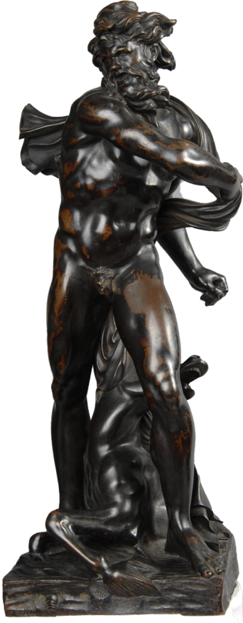
Michel Anguier (d'après), Neptune , Fin du 17 e siècle | Bronze (salle 3)

L' Odyssée , poème épique attribué au poète Homère, raconte les nombreuses aventures du roi d'Ithaque, Ulysse, qui après s'être distingué durant la guerre de Troie, mettra dix ans à regagner son île afin de retrouver son épouse Pénélope et son fils Télémaque.