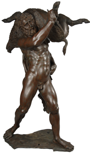
Travail n°4, Hercule et le sanglier d'Érymanthe , 17 e siècle Italie | Bronze (salle 3)