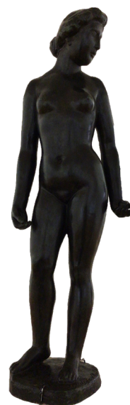
Aristide Maillol, Eve à la pomme , 1899 | Bronze (salle 12)