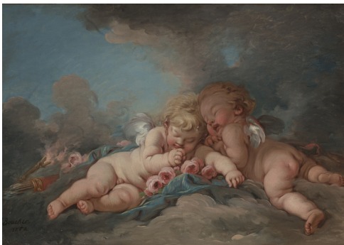
François Boucher, Les amours endormis , 1762 | Huile sur toile (salle 3)

Inspiré par l'art de la Grèce antique, les putti ou spiritelli (petits esprits ailés) sont représentés sous la forme d'un enfant ailé, souvent nu et joufflu mais ne doivent pas être confondus avec Cupidon. Redécouverts à la Renaissance, ils deviennent très présents. François Boucher, peintre, dessinateur et décorateur français du style Rococo, devient célèbre dès 1720 pour ses portraits et peintures décoratives. Les amours endormis et les amours éveillés sont caractéristiques du style Rococo qui présente des couleurs pastel, des lignes incurvées et des sujets légers liés à l'amour et à la courtoisie. Originellement destinés à être accrochés au-dessus des portes, les tableaux de la Fondation revisitent ce motif au 18 e siècle.