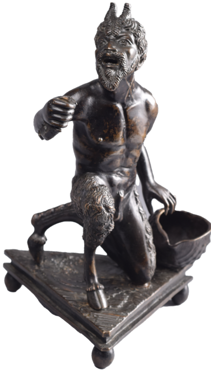
Severo da Ravenna (atelier de), Encrier : un satyre , début du 16 e siècle | Bronze (salle 4)

Réalisé vers 1500 par Severo da Ravenna, sculpteur et orfèvre ayant œuvré entre Padoue et Ravenne, ce satyre n'est pas seulement une sculpture en soi mais aussi un objet usuel : l'encrier. Le satyre est un motif très répandu à l'époque dans ce que l'on appelle les objets de table (encrier, flambeaux etc.). La figure du Satyre incarne la puissance des forces primitives qui permettent de renouer avec la nature.